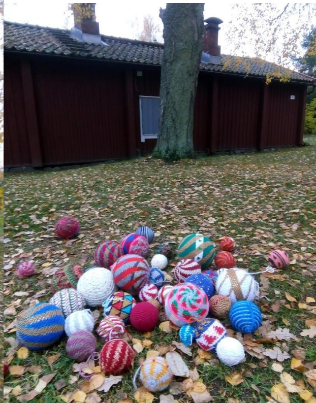
Kuvat: Heli Hyytiä