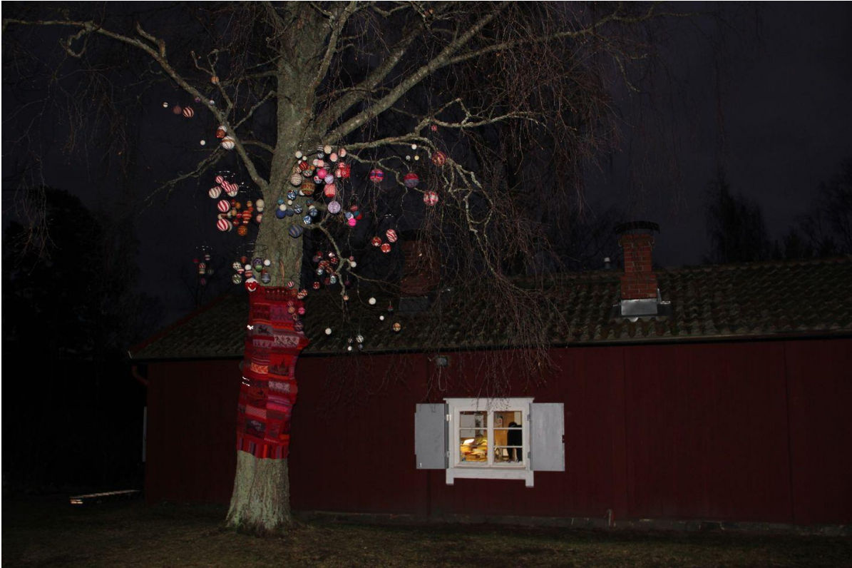
Illalla kaikki 160 palloamme keinuivat hiljaa koivun oksilla