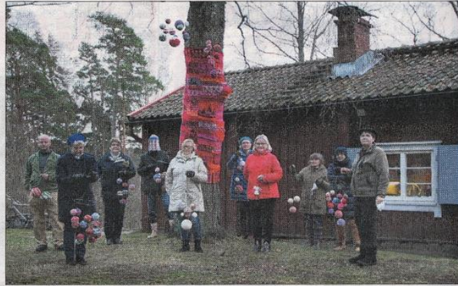
Joulukoivun koristajia Sjäkullan pihalla.

Oikein mukavaa joulun ajan odotusta kaikille vuosaarelaisille!